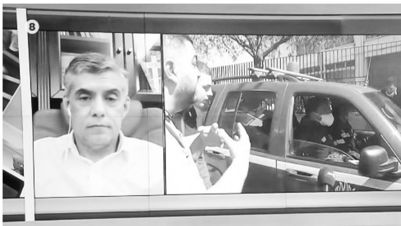
ΚΩΣΤΑΣ ΑΓΟΡΑΣΤΟΣ - ΠΕΡΙΦΕΡΕΙΑΡΧΗΣ ΘΕΣΣΑΛΙΑΣ

Καθιέρωσαν τον αποκλεισμό περιοχής μέσα σε πόλη, ενώ ο περιφερειάρχης Αγοραστός διέταξε, πως αν χρειαστεί θα έρθει και ο στρατός για να γίνει εφικτός ο αποκλεισμός. Ξεκίνησαν να κάνουν τεστ πηγαίνοντας σε ένα ένα σπίτι και υποχρεωτικά έπαιρναν δείγματα. Όσων το τεστ έβγαине θετικό τους απομάκρυναν σε ένα χώρο αποκλειστικά για τον SARS-COV2, για να εκτίσουν την ποινή της καραντίνας των 14 ημερών. Αυτά δεν συνέβησαν πουθενά αλλού, ούτε εξηγήθηκαν, ούτε προειδοποιήθηκαν πως θα γίνουν. Μήπως θα περίμενε κανείς από το κράτος να μας ρωτάει πριν μας φυλακίσει, πριν μπει στο σπίτι μας, ή πριν φέρει το στρατό στις πόλεις;